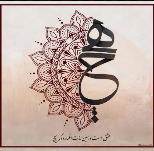
مشق است و همین لذت نامرور کز آنج