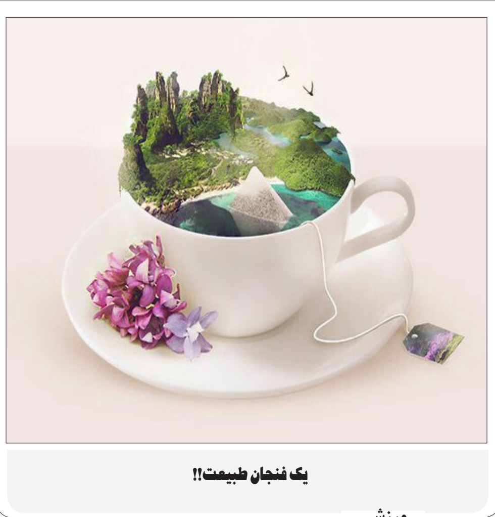
یک فنجان طبیعت!!

«ششمین هفته معماری اسپانیا» از پنجشنبه ۲۳ آذر در خانه هنرمندان ایران برگزار خواهد شد؛ به همین سبب ۴۶ عکس از آثار دو معمار اسپانیایی نمایش گذاشته خواهد شد به گزارش اسپانیا، ششمین «هفته معماری اسپانیا» با هماهنگی بخش فرهنگی سفارت این کشور در ایران برگزار خواهد شد؛ «هفته معماری اسپانیا» عصر پنجشنبه (۲۳ آذر ۱۴۰۲) ساعت ۱۵:۳۰ در سالن استاد جلیل شهناز افتتاح خواهد شد. سانتیاگو پوراس، اوربول پونس و فرهاد آزرمی، سخنرانان افتتاحیه ششمین هفته معماری اسپانیا هستند؛ همچنین آنخل لوسادا فرناندس، سفیر اسپانیا مهمان ویژه افتتاحیه این برنامه خواهد بود. در هفته معماری اسپانیا، ۴۶ عکس از آثار دو معمار برجسته اسپانیایی که پروژه‌های متعددی در نقاط مختلف دنیا اجرا کرده‌اند در گالری تابستان به نمایش گذاشته می‌شود. بر اساس آنچه که خانه هنرمندان ایران اعلام کرده است، شنبه و یکشنبه (۲۵ و ۲۶ آذر) خانه هنرمندان تعطیل است و علاقه‌مندان می‌توانند برای بازدید از نمایشگاه آثار ششمین هفته معماری اسپانیا، تا ۲۰ آذر ۱۴۰۲ به گالری تابستان این مجموعه مراجعه کنند.