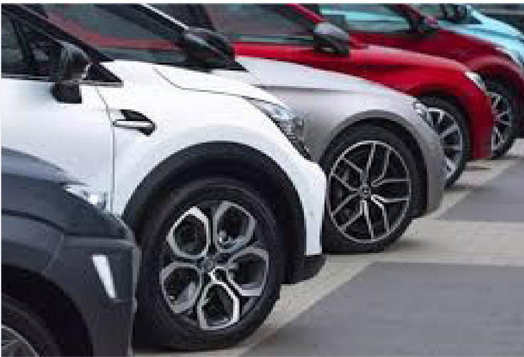
وزیر صنعت، معدن و تجارت عنوان کرد