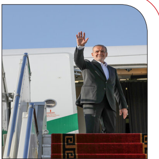
برای حضور در مجمع عمومی سازمان ملل:

پزشکیان یک‌شنبه عازم نیویورک می‌شوند رئیس‌جمهور یک‌شنبه اول مهرماه به‌منظور حضور و سخنرانی در مجمع عمومی سازمان ملل عازم نیویورک خواهد شد. به گزارش خبرگزاری مهر، مسعود پزشکیان رئیس‌جمهور یک‌شنبه یک مهرماه به‌منظور حضور و سخنرانی در مجمع عمومی سازمان ملل سه‌شنبه ۳ مهرماه خواهد بود که به بیان دیدگاه‌های ملت ایران خواهد پرداخت. این سفر هرساله در اواخر شهریور و با اوایل مهرماه صورت می‌گیرد و رؤسای جمهور کشورمان در ادوار مختلف به بیان نظرات و مسائل مورد نظر می‌پردازند. سخنرانی در اجلاس جانبی مجمع عمومی به‌نام «سران برای آینده»، دیدار با ایرانیان مقیم آمریکا، گفتگو با رهبران ادیان الهی، نشست با مدیران رسانه‌ها، اندیشکده‌ها و دیگر دیدارهای دوجانبه با برخی سران کشورهای اروپایی، آسیایی و جهان اسلام از جمله برنامه‌های احتمالی رئیس‌جمهور کشورمان است.