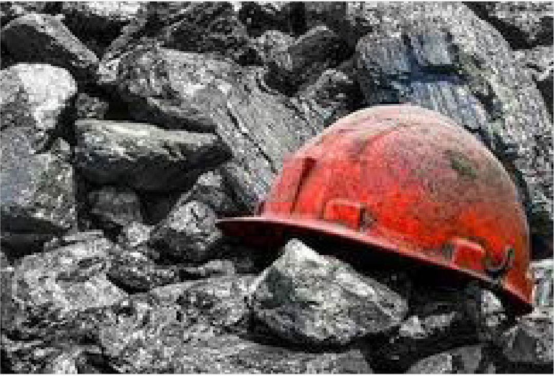
در گفت‌وگو با ایسنا مطرح شد