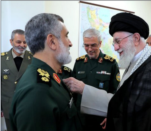
پیام سردار جلالی به سردار حاجی‌زاده