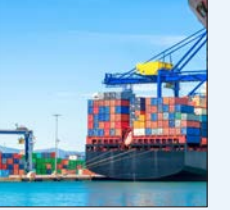
سختگوی کمیسیون توسعه تجارت خانه صمت: