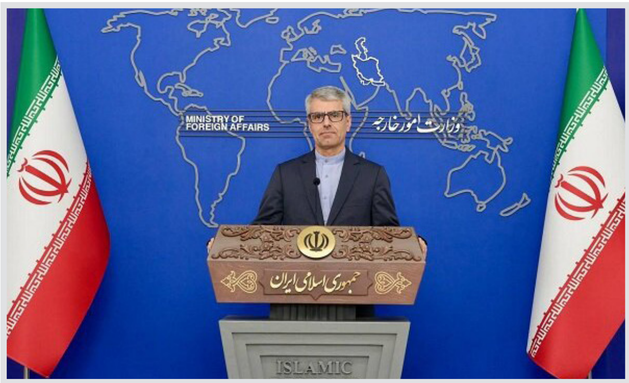
سخنگوی شورای نگهبان در نشست خبری:

سخنگوی وزارت امورخارجه با یادآوری مشروعیت مبارزات مسلحانه ملت‌های تحت سلطه استعمار با اشغال یا اپارتاید برای کسب حق تعیین سرنوشت، طبق حقوق بین الملل، حمایت جمهوری اسلامی ایران از مقاومت فلسطین و لبنان علیه اشغالگری و اپارتاید را منطبق با موازین حقوق بین الملل توصیف نمود و از شورای اروپا خواست مبنای و هنجارهای تثبیت شده حقوقی بین المللی را قربانی حمایت غیرقانونی و غیراخلاقی خود از موجودیت اشغالگر نکنند بقایی همچنین با ابراز تأسف از توصیف واژه رژیم شوروی اروپا از عملیات موشکی ایران به رژیم صهیونیستی - که به عنوان اقدامی دفاعی و مشروع در برابر تجاوزات رژیم اسرائیل علیه حاکمیت ملی و تمامیت سرزمینی و نیز تعرض به اتباع و اهداف ایران انجام شد - تصریح کرد: عملیات وعده صادق ۲ مه‌مانند وعده صادق ۱ مطابق با ماده ۵۱ منشور ملل متحد و اقدامی مسئولانه و منطقی برای حراست از صلح و امنیت منطقه بود.