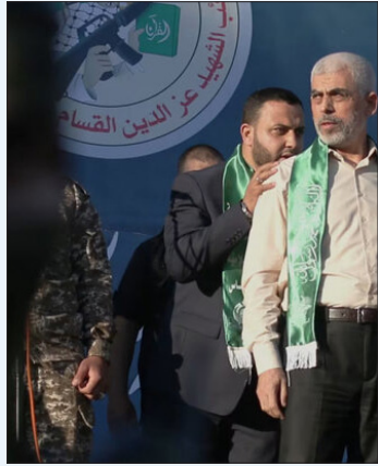
خواواده شهید قاسم سلیمانی

خواواده شهید قاسم سلیمانی در پی شهادت یحیی السنوار در پیامی تاکید کردند که لحظات پایانی عمر مادی شهید یحیی السنوار، با خلق صحنه شرافت و ایستادگی جاودانه شد.به گزارش ایسنا، متن این بیانیه به شرح ذیل است: إِنَّ اللَّهَ يُحِبُّ الَّذِينَ يُقَاتِلُونَ فِي سَبِيلِهِ صَفًا كَأَنَّهُمْ بُنْيَانٌ مَرْصُوفٌ سیاهه جنایات رژیم سفاک و سگ هار آمریکا در منطقه، پایان ندارد و این بار رژیم غاصب دستاخش به خون مجاهد بزرگ، شهید «یحیی السنوار» لوده شد. مبارزی که عملکرد پر افتخارش در طول این سال‌ها، او را به کاپوس رژیم کودک‌کش بدل کرده بود. او همراه با مبارزان فلسطینی، عملیات غرورآفرین طوفان‌الاقصی را رقم زد و توانست هیمنه پوشالی رژیم خونخوار را بشکند و نقشه‌های خیانت‌آلود دشمنان دنیای اسلام را، یکجا نقش بر آب کند. لحظات پایانی عمر مادی شهید یحیی السنوار، با خلق صحنه شرافت و ایستادگی جاودانه شد و زندگی این مجاهد عزیز افزون بر چگونه زیستن، چگونه مردن را نیز به بشریت آموخت. اگر چه دشمن صهیونیستی ماها برای یافتن او، زیر زمین را جست‌وجو کرد و خواست او را فرماندهی ترسو و جدا از زندمندان معرفی کند، اما سرانجام او در خط مقدم میدان، با دستائی پر قدرت و سلاح به دست نمایان شد و راسخ بودن مقاومت او را بار دیگر به جهانیان نشان داد.