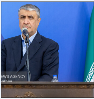
رئیس سازمان انرژی اتمی در آیین افتتاحیه اولین کارخانه فرآوری و آلودگی زایی از خشکیار بر پایه فناوری پلاسما، اظهار داشت: چرخه فعالیت و فرایند خلایق و نوآوری بتواند حل مسئله انجام دهد و برای نیازهای مردم پاسخگو باشد.

رئیس سازمان انرژی اتمی از راه اندازی ۴ مرکز فرآوری خشکیار با فناوری پلاسما در روزها و هفته‌ها و ماه‌های آینده در استان‌های گیلان، خوزستان و خراسان رضوی و اردبیل خبر داد. به گزارش خبرنگار مهر، محمد اسلامی در آیین افتتاحیه اولین کارخانه فرآوری و آلودگی زایی از خشکیار بر پایه فناوری پلاسما، اظهار داشت: چرخه فعالیت و فرایند خلایق و نوآوری بتواند حل مسئله انجام دهد و برای نیازهای مردم پاسخگو باشد. وی ادامه داد: در سازمان انرژی اتمی عبور از فاز تحقیقات و وارد فاز صنعتی شدن یکی از تأکیدات بوده است. رئیس سازمان انرژی اتمی افزود: امروز در کشور خودمان از فاز تحقیقات عبور کردیم و وارد صنعتی شدیم که این یک گام اساسی و راهبردی و نقطه آغاز است. اسلامی گفت: امیدواریم استفاده از فناوری پلاسما افت پذیری محصولات از بین برود و این نقطه آغاز بزرگ باشد. اسلامی افزود: این یک گام اساسی و یک نقطه آغاز است تا عملاً برای جلوگیری از آسیب‌ها گشایش ایجاد شود و همچنین گشایشی برای فعالان این حوزه در بخش صادرات باشد. رئیس سازمان انرژی اتمی در پایان از راه اندازی و افتتاح ۴ مرکز فرآوری خشکیار با فناوری پلاسما در روزها و هفته‌ها و ماه‌های آینده خبر داد و گفت: این مراکز در استان‌های گیلان، خوزستان و خراسان رضوی و اردبیل افتتاح خواهند شد.