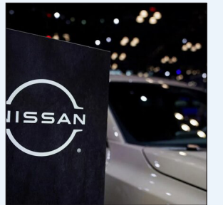
رنامه کاهش نیروی کار جهانی در جنوب شرق آسیا محقق شد؟