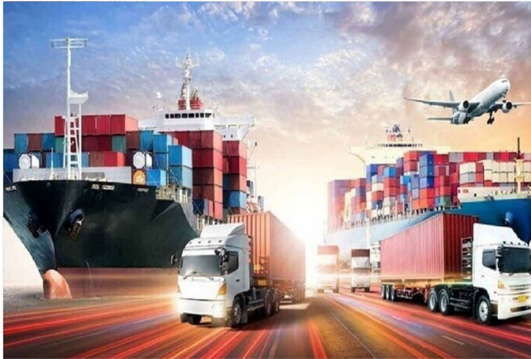
رئیس اتاق مشترک ایران و عراق مطرح کرد