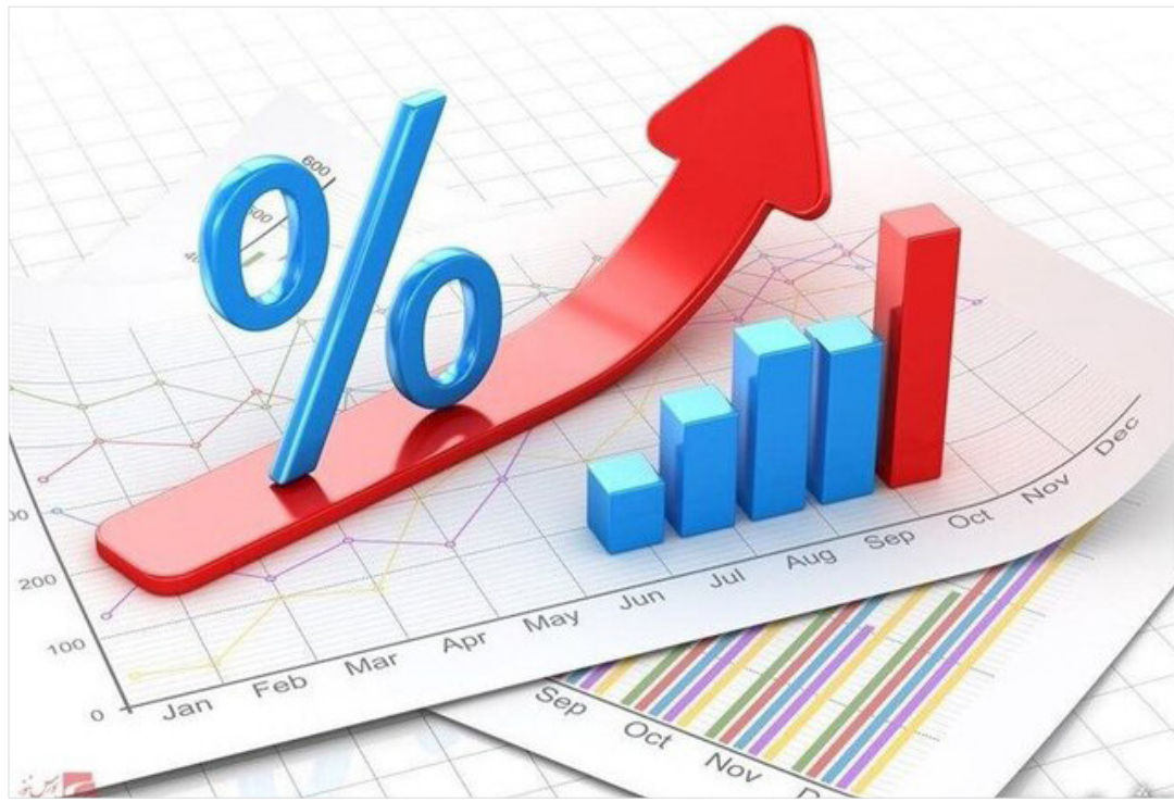
بانک مرکزی اعلام کرد: