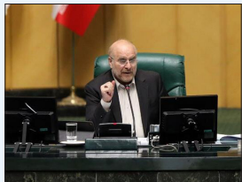
مدیرعامل شرکت مدیریت تولید برق نکا خیرداد