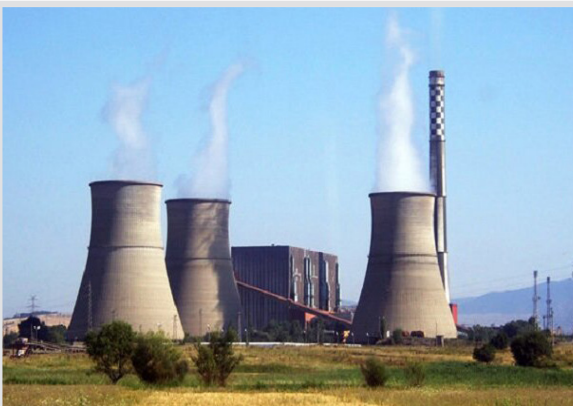
یکی از موضوعاتی که به‌عنوان علت خاموشی‌ها مطرح می‌شود کمبود ذخیره سوخت نیروگاه‌ها است، مساله‌ای که اگر مورد توجه قرار می‌گرفت ممکن بود اکنون با چنین