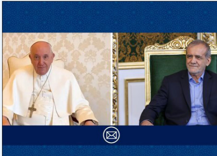
به مناسبت سالروز میلاد حضرت عیسی بن مریم (ع) انجام شد