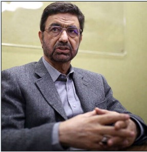
هولوکاست واقعی در غزه