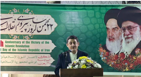
خارجه نیجریه، پیام وزیر خارجه نیجریه را به مناسبت چهل و ششمین سالگرد پیروزی شکوهمند انقلاب اسلامی قرائت کرد. معاون مجلس سنا و همچنین وزیر مشاور در قلمرو پایتخت فدرال (FCT) نیز با ایراد سخنانی بر توسعه مناسبیت دو کشور تأکید کردند.

با ترویرست است. سرلشکر باقری در ادامه این دیدار، از عمان برای همکاری‌های سیاسی با ایران تشکر کرد. رئیس ستاد کل نیروهای مسلح خاطرنشان کرد: با توجه به خوی وحشی‌گری و توسعه‌طلبی رژیم صهیونیستی که همواره به دنبال توسعه سرزمینی است؛ تنها راه مقابله با این رژیم اشغالگر و تروریست، اتحاد و همدلی کشورهای منطقه است. در بخش دیگری از این دیدار، طرفین ضمن بررسی اوضاع منطقه به خصوص نسل‌کشی مردم مظلوم فلسطین در غزه، طرح شوم کوچاندن و اخراج فلسطینیان از سرزمین مادری آن‌ها را به شدت محکوم کردند. در این دیدار با سرلشکر محمد باقری رئیس ستاد کل نیروهای مسلح جمهوری اسلامی ایران همکاری مناسبی بین نیروهای نظامی و امنیتی دو کشور برقرار است. در این دیدار، با بیان اینکه روابط دو کشور از دیرباز بر حسن اعتماد متقابل بنا شده است، گفت: عمان همواره بر توسعه روابط دو کشور در تمامی سطوح تأکید دارد. وی افزود: همواره تعامل و همکاری مناسبی بین نیروهای نظامی و امنیتی دو کشور برقرار است. در این دیدار، رئیس ستاد کل نیروهای مسلح عمان و ایران تصریح کرد: هماهنگی‌های خوبی برای گسترش تعامل طرفین در حوزه‌های زمایش‌های دریایی، آموزشی، نظامی، فنی و صنعتی و پلیس امنیت دریایی شکل گرفته است. وی ادامه داد: با توجه به تحولات اخیر منطقه، ما همه تلاش خودمان را برای خردگرایی در منطقه به کار خواهیم گرفت، چرا که ملت‌های منطقه صاحبان این منطقه هستند. البته متأسفانه برخی کشورهای فرامنطقه‌ای در صدد اختلال در همکاری‌ها هستند.