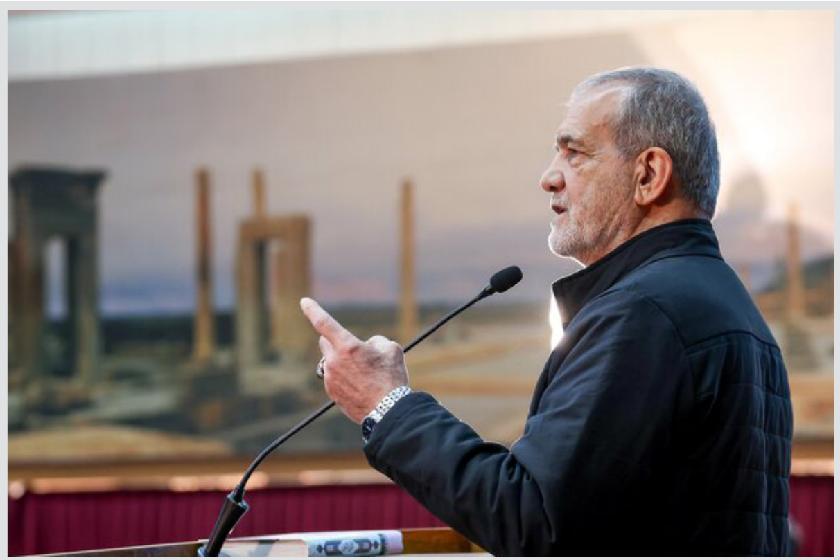
رئیس‌جمهور کشورمان گفت: صلح و امنیت جهانی با ارتباط، دوستی و با صمیمیت امکان‌پذیر است. صلح و امنیت با تجاوز با قتل با کشتار با اخراج و تبعیض امکان‌پذیر نیست.