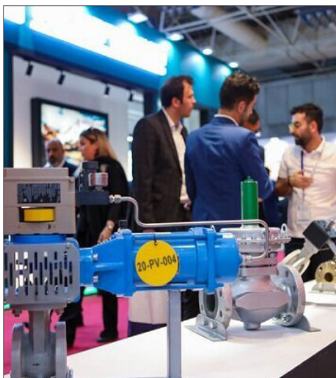
با حمایت مرکز تعاملات بین المللی صورت می گیرد؛