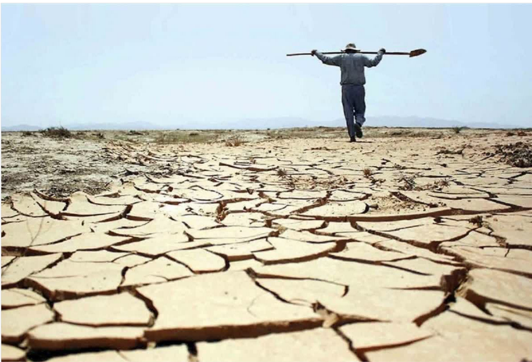
مدیر دفتر حفاظت و بهره‌برداری آب منطقه‌ای خراسان رضوی: