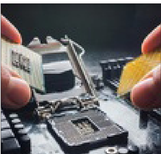
توسط ستاد اقتصاد دانش‌بنیان دیجیتال